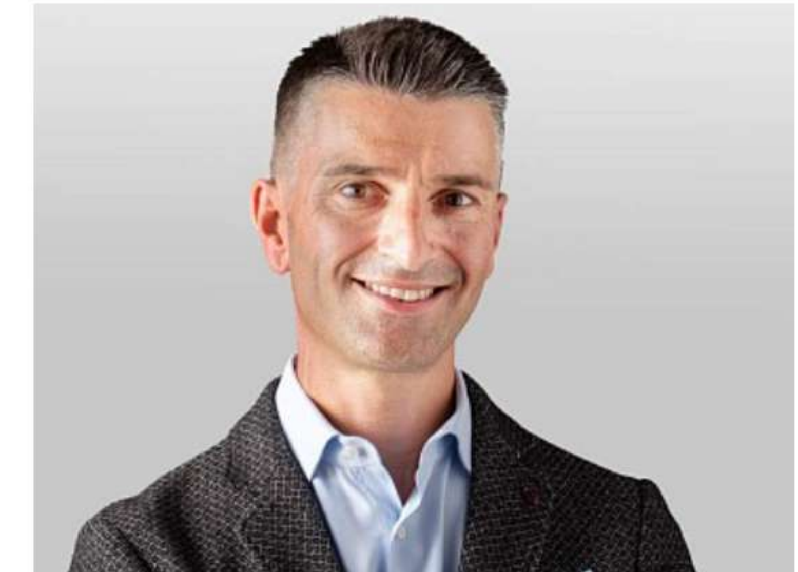
Sun Tzu Consulting: 2023 di crescita in crowdfunding e nel food retail