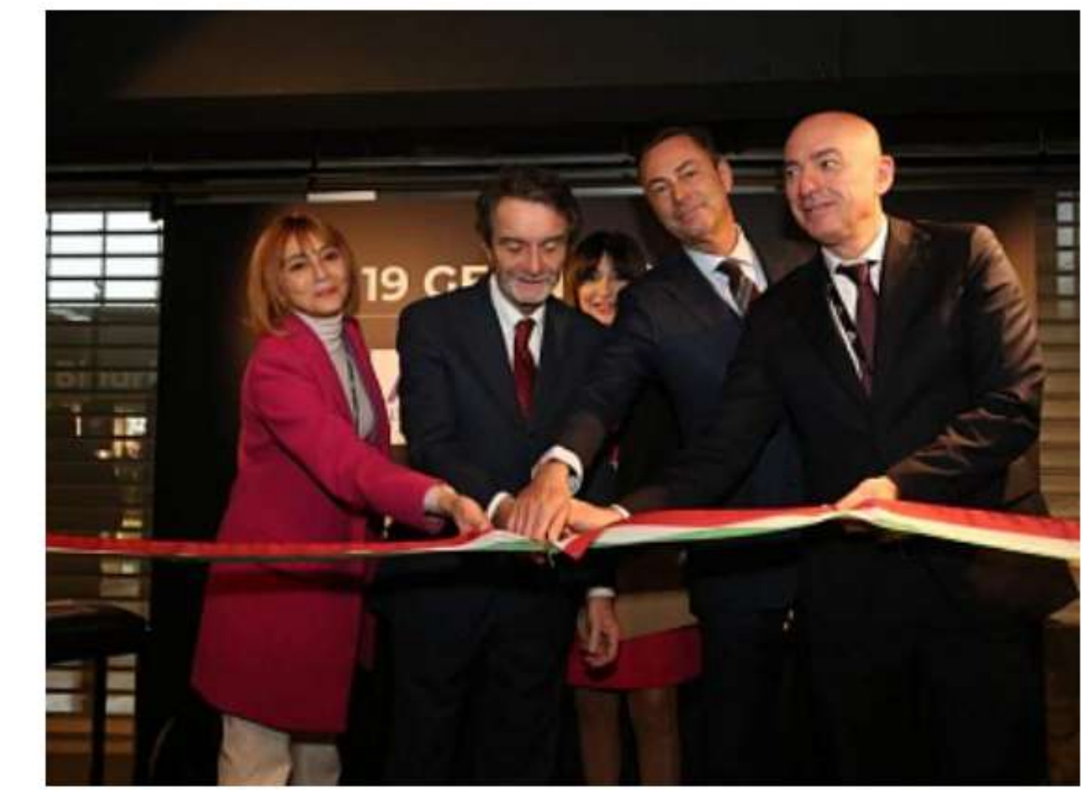
Chef Express, nuova food hall alla stazione Milano Porta Garibaldi